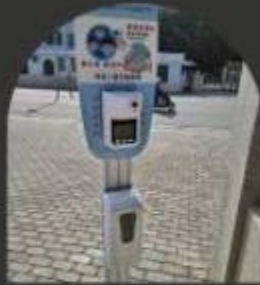
STEP2. 酒精消毒 & 量 額溫